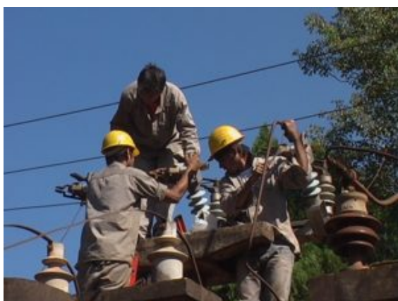
Personal de Emsa trabajando

MISIONES – PUERTO IGUAZÚ – A las 9:30 de este viernes salió de servicio un interruptor de la Estación Transformadora “Iguazú”, provocó que un sector importante de la ciudad de Puerto Iguazú no disponga del servicio de provisión de energía eléctrica. Desde Emsa informaron que la avería producida es importante por lo que estimaron que mínimamente necesitarán de 6 horas para su reparación.