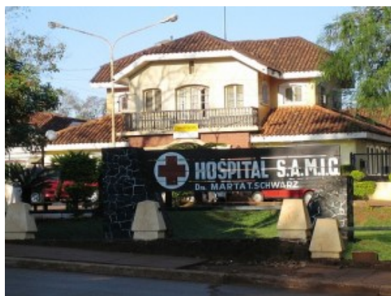
Hospital Marta Teodora Schwartz Samic Iguazú