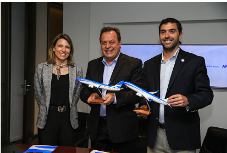
Foto – Firma de convenio entre Aerolíneas Argentina y ANSES, en la cual se aplicaría un descuento del 30% para jubilados y pensionados dentro del territorio nacional Argentino.

ARGENTINA – BUENOS AIRES – CAPITAL FEDERAL – Aerolíneas Argentinas, el Ministerio de Turismo de la Nación y la ANSES firmaron un acuerdo que otorga beneficios a los jubilados y pensionados para realizar viajes a todos los destinos del país que cubre la línea de bandera.